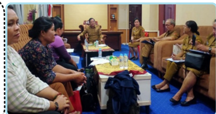
Audiensi kontrak politik & Silaturahmi dengan Bupati Nias Barat

Terlaksana advokasi ke Bupati terpilih Kab. Nias Barat, Kab. Dairi & Kab. Humbang Hasundutan. Memastikan rumusan kontrak politik dituangkan dalam program OPD secara bertahap melalui proses Musrenbang. Diharapkan kerjasama dengan PESADA/FKPAR komunikasi aktif (PERBUP tahun 2025 tentang pencegahan dan penanganan perkawinan usia < 19 tahun.