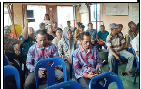
Audiensi kepada Pemerintah Desa Bongkaras (19 September 2025)