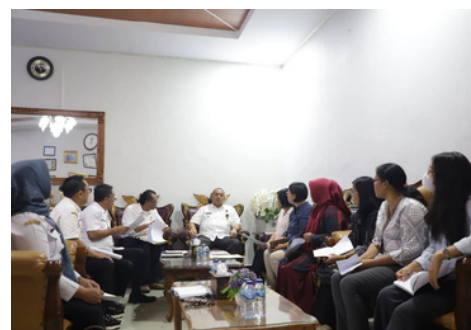
Audiensi kontrak politik & Silaturahmi dengan Bupati Kab. Dairi

Pemerintah Desa Pakkat melibatkan kader utama dalam kegiatan-kegiatan desa dan memilih ybs. menjadi sekretaris PKK. Kepala Desa Aek Lung konsultasi kepada PESADA untuk program PKK Desa.