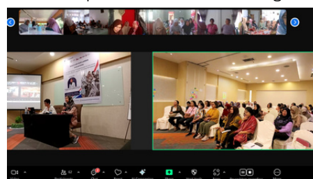
Perayaan Hari Lansia secara hybrid di 8 Provinsi dampingan PERMAMPU