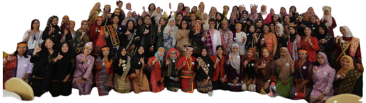
Perayaan Hari Perempuan Pedesaan, Pengakhiran Pemiskinan untuk Kedaulatan Pangan 14 Oktober 2025 di Samosir bersama dampingan PERMAMPU dari 8 Provinsi