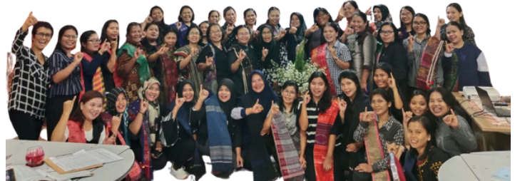
Perayaan Hari Perempuan Internasional dilaksanakan secara hybrid di 8 Provinsi dampingan PERMAMPU (8 Maret 2025)