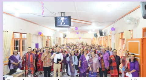
Foto bersama seluruh peserta perayaan Ulang Tahun ke 35 (Lustrum ke VII) PESADA

Di tanggal 30-31 bulan Oktober 2025, dengan jumlah peserta 192 Orang ( 181 Pr, 11 lk) PESADA merayakan lustrum ke 7 atau Ulang Tahun ke -35 dengan tema: Mengakar, Menguat dan Berbagi. PESADA melakukan Refleksi Perjalanan PESADA menuju Lustrum ke 8 yang diangkat menjadi sumber pembelajaran yang paling berharga. Pengalaman sebagai lembaga feminis yang fokus terhadap pentingnya meningkatkan kepemimpinan perempuan dan perlunya mendokumentasikan pengalaman perempuan agar menjadi referensi dalam membangun gerakan perempuan. Oleh karena itu PESADA mempublikasikan 3 buku elektronik mengenai pengalaman hidup perempuan yaitu: Datita Ginting, Theodora Hutabarat alm. dan Wallia Keliat Liman yang ditulis oleh J Anto & Dina Lumbantobing. Juga menulis paper Antologi Tulisan PESADA selama 35 tahun. PESADA menganalisis setiap kegiatan yang dianggap berkontribusi besar dalam mendewasakan perjalanan PESADA. Dengan demikian arah PESADA menuju lustrum ke 8 atau usia 40 tahun, akan menguatkan perempuan untuk semakin resilien dalam memperjuangkan gerakan perempuan dan kelompok marjinal lainnya. Kesempatan ini juga digunakan untuk memaknai dan mempublikasikan perubahan nama PESADA menjadi Pesada Perempuan Pembaharu.